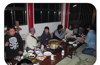
神様のお戻りです