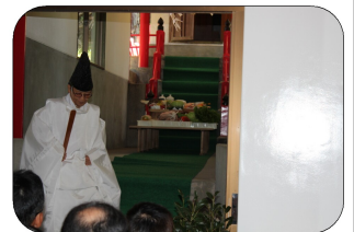
神々に供物を捧げました 耕地整理記念祭