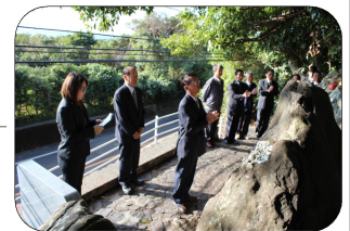
代表者により祈願